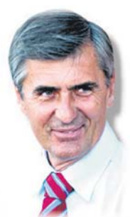
Védőváltások Szombaton a Győr vizitál a Szparinál, teljes odaadás kell a győzelemhez. /11.