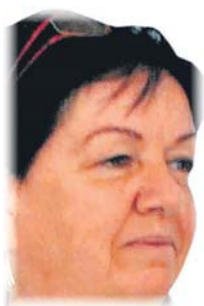
Finomság A nyírteleki házaspár ételkülönlegességeinek nagy közönségsikere volt. /10.