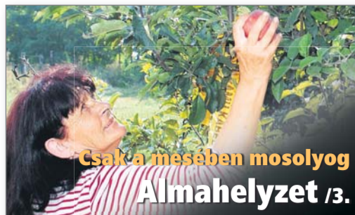
Csak a mesében mosolyog Almahelyzet /3.