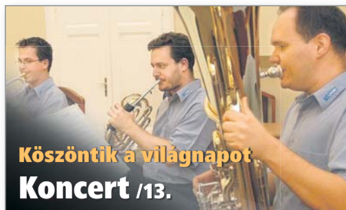
Köszöntik a világnapot. Koncert /13.