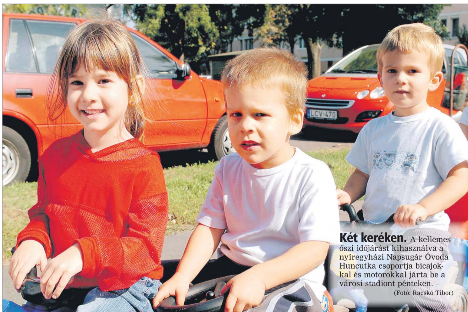
Két keréken. A kellemes őszi időjárást kihasználva a nyíregyházi Napsugár Óvoda Huncutka csoportja bicajokkal és motorokkal járta be a városi stadiont pénteken.

holdingként működik, így nem tehetik meg, hogy nem beszélnek a szerződésekről, melyek nem teljes körűek, pongyolán megfogalmazottak, s egyáltalán nem megnyugtatók – mondta, s a frakció nevében azt javasolta, hogy függeszék fel az átalakítási folyamatot. Dr. Kiss Zoltán, a holding vezérigazgatója kijelentette: ez lehetetlen. /14.