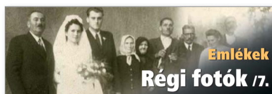
Emlékek Régi fotók 17.