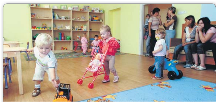
Kicsik nagy öröme. Csütörtökön adták át a Mese-híd Gyerekházat Dombrádon, amelyet azon nyomban birtokba vettek a csöppségek.