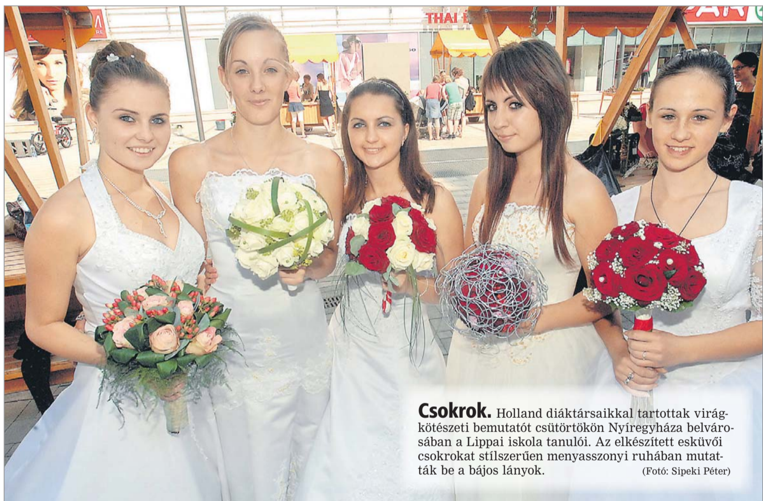
Csokrok. Holland diáktársaikkal tartottak virágkötészet bemutatót csütörtökön Nyíregyháza belvárosában a Lippai iskola tanulói. Az elkészített esküvői csokrokat stílszerűen menyasszonyi ruhában mutatják be a bájos lányok.