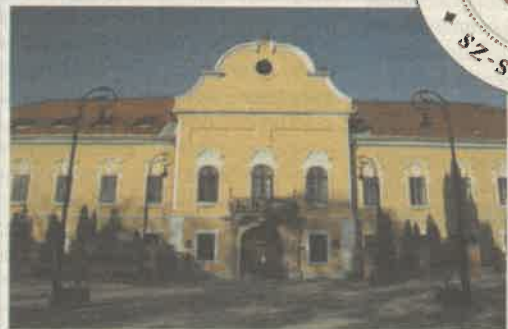
SÁNTHA KÁLMÁN SZAKKÓRHÁZ NAGYKOVÁCSOK