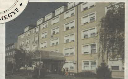
TERÜLETI KÓRHÁZ MÁTÉSZALKA