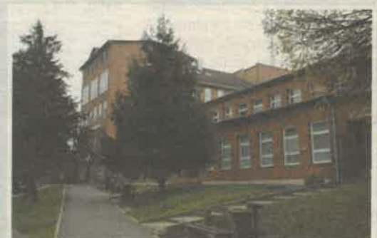
SZATMÁR-BEREGI KÓRHÁZ ÉS GYÓGYFÜRDŐ FEHÉRGYARMAT