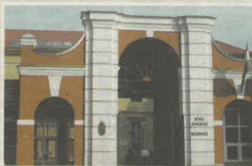
JÓSA ANDRÁS OKTATÓKÓRHÁZ NYÍREGYHÁZA

informatikai és kommunikációs szolgáltatásokat, ennek egyik kiváló példája a Nyíregyházi Holdinggal való együttműködésünk. Ha egy intézmény úgy dönt, hogy feltülvizsgálja és megreformálja info- vagy telekommunikációs rendszerét, mi partnerek vagyunk hozzá. Érdemes körültekintőnek lennie az intézményeknek, amikor partnert választanak, mert nagyon nagy a szolgáltató felelőssége. Nem lehet hibázni: egészségről, életéről van szó. Nem fordulhat elő, hogy nincs kapcsolat az intézmények között, nem elérhetőek a betegadatok vagy megszakad az összeköttetés extrém esetben egy donor adatbankkal” – mondta el Zsembery György, az Invitel vezérigazgató helyettese.