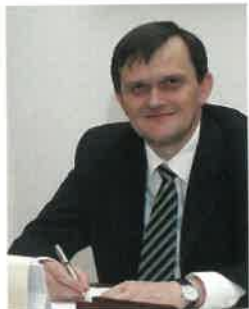
Seszták Oszkár a Szabolcs-Szatmár-Bereg Megyei Közgyűlés elnöke

elnevezésre kívánja módosítani. A változtatás szükségességét az egyre bővülő szakmai és ellátási tevékenységi kör hívta életre, és az, hogy a köztudatba mélyen beívódott közvélekedés javuljon.