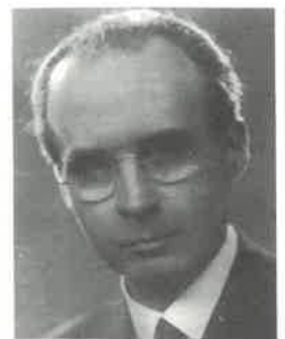
Prof. Sántha Kálmán

Az orvosi szakmában kiemelkedő elismertsége és méltó életpályája ösztönözte Szakkórházunk vezetését arra, hogy az intézmény Sántha Kálmán nevét vegye fel, ezzel hűen tükrözne az ország legnagyobb ilyen jellegű szakkórháza kiváló szakmai háttérét, nagy múltú tradícióit és felkészültségét, mellyel, mint egészségügyi szolgáltató megfelelő ellátást nyújt az arra rászorulóknak számára.