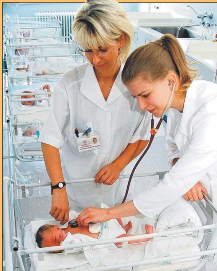
Átlagosan 4 nap után hazavihetik a gyermeküket a szülők

házi elmondható, hogy nem csak hogy akadálymentes, de egyike az országban azoknak az intézményeknek, ahol a legtöbb egy- és kétágyas kórterem található. – De ha egy másik példát nézünk, például a daganatos