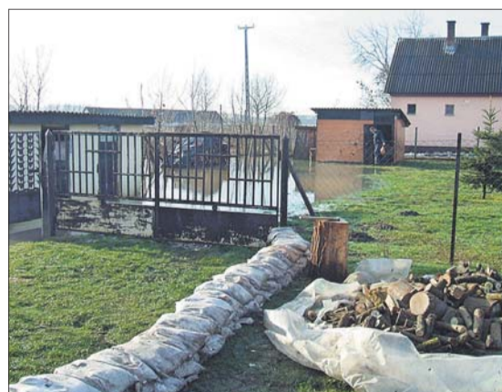
Sikerült megvédeni a veszélyeztetett épületeket és lakóikat

Fülesd (KM) – Az év első napján nagy gondot okozott a belvíz Fülesden, mivel a „Cibere” patak környezetében összegyűlt nagy mennyiségű esővíz lakóházakat veszélyeztetett. A megyei katasztrófavédelmi igazgatóság ügyeletére érkezett lakossági bejelentést követően a Fehérgyarmati Polgári Védelmi Kirendeltség vezetője 1000 darab homokzsákot szállított a helyszínre, ahol kiderült: a Fő utcán és a Kossuth utcában összesen négy lakóházat, valamint Magosligeten egy lakóépületet veszélyeztetett a belvíz. Több mint harmincan láttak neki a zsákok feltöltésének és a lakóépületek megvédésének, a veszélyeztetett épületekben élő felnőtteket és gyermekeket nem kellett kitelepíteni az otthonukból, az épületekben sem keletkezett kár.