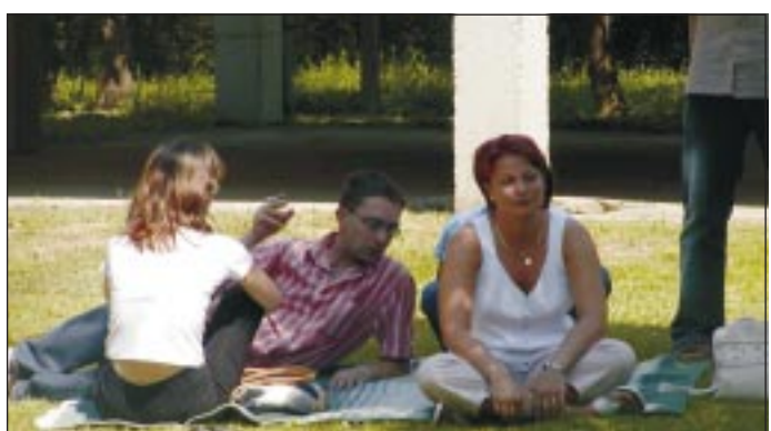
A természet lágy ölné... akinek nem jutott a tivadari ünnepségen szék.