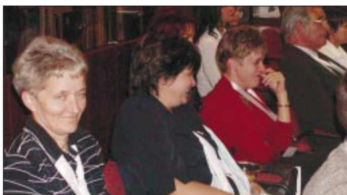
A hátsó sorban történnek a vicces dolgok - úgy tűnik.