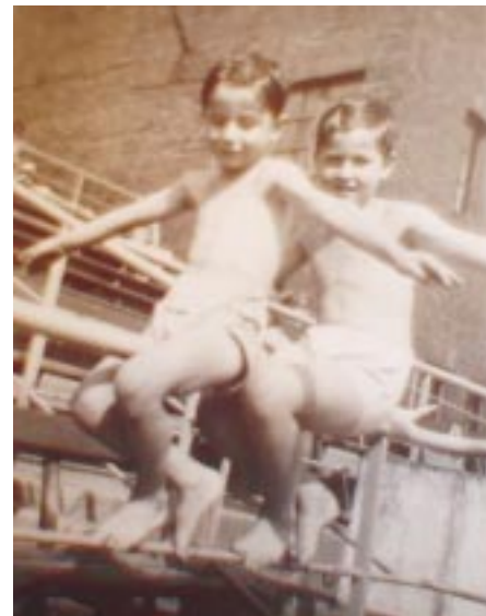
Elöl én, mögöttem a bátyám

megkérdezte, hogy lenne egy 6 hónapos valami, valahol, nem vállalnám-e el. Annyira abszurd volt az ötlet, hogy eljöttem ide, ahol azelőtt sosem jártam és megtetszett. Megtetszett a főigazgatónő abszolút hozzáállása, a felvázolt célokba vetett hite, és úgy éreztem, hogy ezt segíteni kell. Persze hat hónapot ugye a jég hátán is... De megtetszett az emberek nyíltsága, barátságossága és a táj szépsége. Ezzel azóta sem tudok betelni, lassan már hat éve. A barátom már egy év után kérdezte, hogy mikor megyek már végre haza. Azóta már járt itt és így valamit már megértett a dolgokból. Én ugyanis itt is otthon vagyok. Nem tudom miért, nem tudom, mi a feladatom, csak csinálom azokat, amiket más nem és örülök, ha valami sikerül. Örülök, ha a Kórház prosperál, fejlődik, vagy csak talpon marad. A kórházi átlagéletkort figyelembe véve már nem vagyok fiatal, de még tervezem a jövőt.