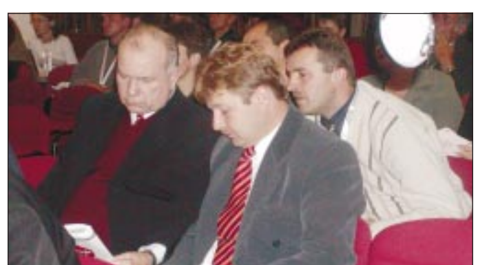
Ti értitek? Hol tartunk?