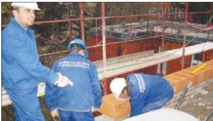
Emberek a tetőn: Fogjuk meg, és vigyétek!