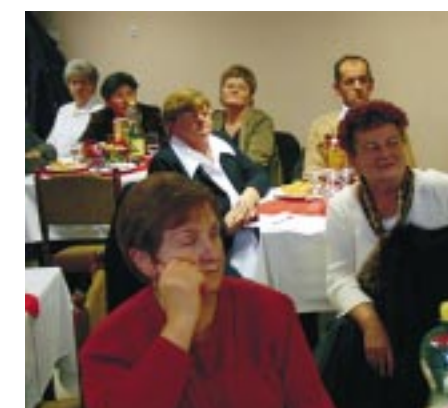
A rendszeres véradók egy csoportja

tette: - Az ünnepségen hallott köszönő szavakat kis csomagként tegyék a karácsonyfa alá, s tekintsék ezt a kórház, a véradó állomás és a Vöröskereszt dolgozóinak ajándékaként.