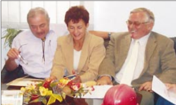
Jól haladnak a rehabilitációs központ munkálatai - legalábbis ezt tükrözi a beruházás felelőseinek arca