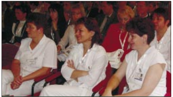
Mosoly nálunk nem csak a betegek jár