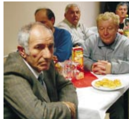
Az ünnepelt segítők