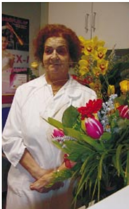
A vezetők virággal gratuláltak

Tudományos érdeklődése a gyermekkori cukorbetegségekre terjedt ki, éveken át jelentős sikerrel szervezte a cukorbeteg apróságok gondozását (ellátását, táboroztatását, stb.). Dolgozott a gyermekosztály fertőző részlegén és koraszülött részlegén, majd 1980-ban az újszülöttkori anyagcsere témában írt kandidátusi disszertációját védte meg. Mivel ennek nyelvvizsga volt a feltétele, előbb angol nyelvből, aztán oroszról vizsgá-