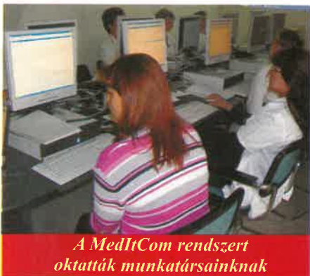
A MedItCom rendszert oktatták munkatársainknak

iránt érdeklődő, vállalkozó kedvű, bátor betegek nagy lelkesedéssel készültek. Az ünnepi műsort József Attila életútjának felelevenítésével kezdtük, majd Petőfi Sándor és József Attila legismertebb verseit hallgattuk meg betegeink tolmácsolásában. A kállósemjéni Rehabilitációs Osztály zenésverses előadása is színesítette a programunkat, melyet előző nap Püspökladányban mutattak be. Az irodalmi délutánt közös énekléssel, gitározással zártuk, majd egy pohár meleg tea és keksz mellett kötetlen beszélgetésre nyílt lehetőség a kultúra kedvelői számára. (A foglalkoztató munkatársak)