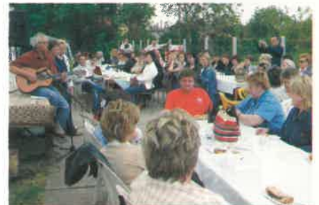
A megnyitón közös énekléssel hangoltak a résztvevők...