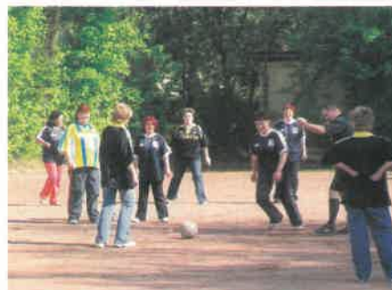
Nem gondoltuk volna, hogy fociban is ennyire tehetségesek a munkatársak...