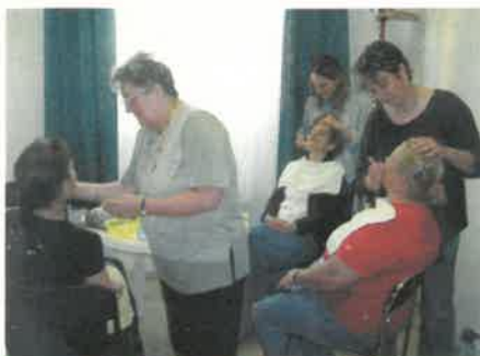
Spakértő kezek kényeztettek a vendégeket...