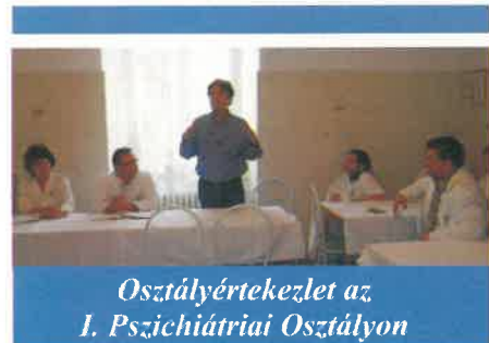
Osztályértékeztetés az I. Pszichiátriai Osztályon