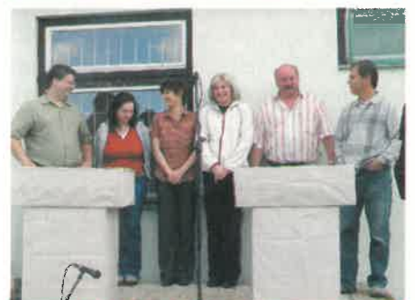
Az Aktivitvben mindhárom páros nagyot alakított...