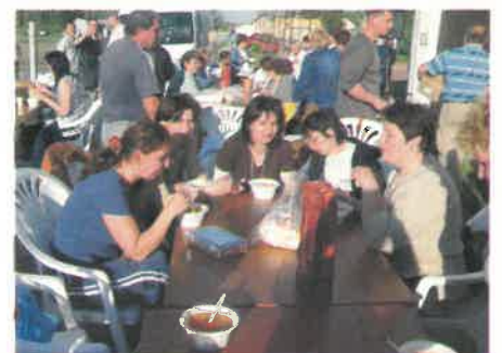
A mozgás után jól esett a pihenés és a finom falatok...