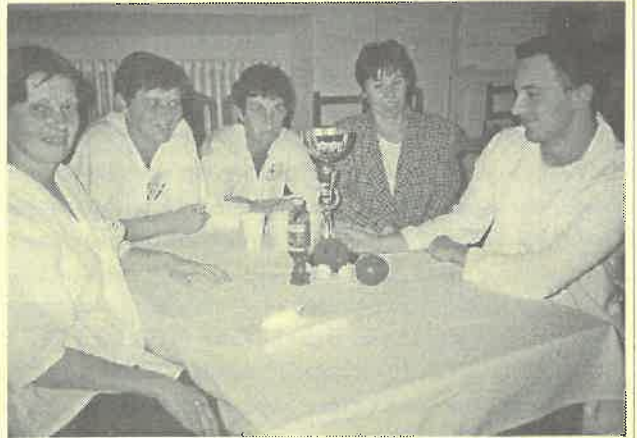
Íme a győztes csapat!