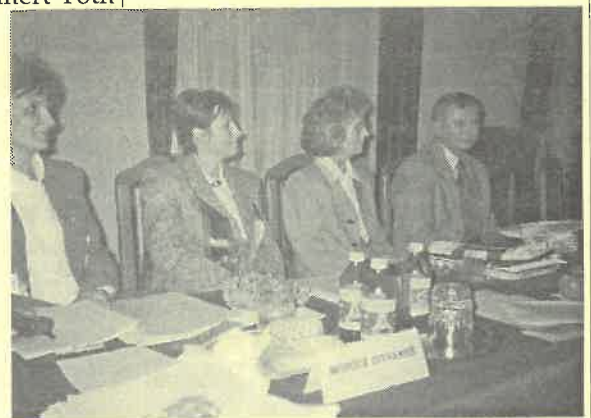
A zsűri élénk érdeklődéssel figyelte az eseményeket