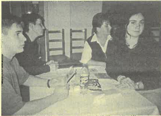
Mikor kerülünk már sorra?