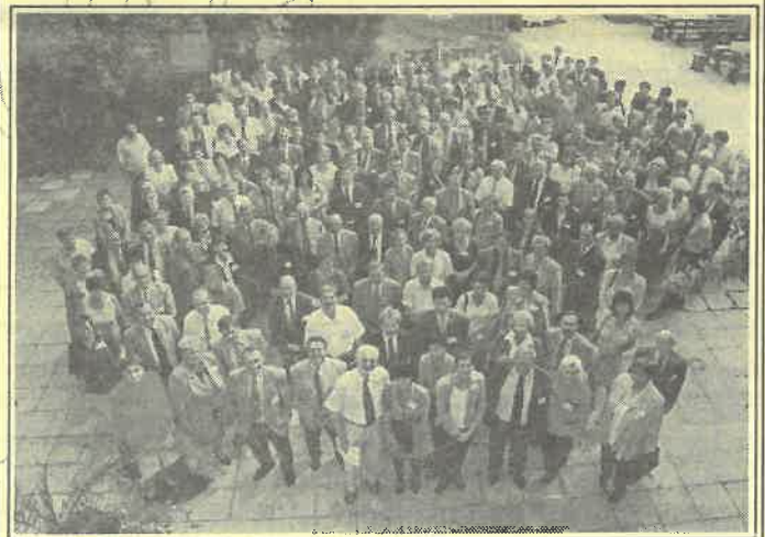
Minőség Fórum Konferenciája Balatonfüreden