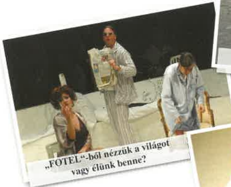
„FOTEL”-ből nézzük a világot vagy élünk benne?