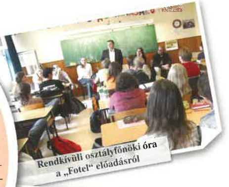
Rendkívüli osztályfőnöki óra a „Fotel” előadásról