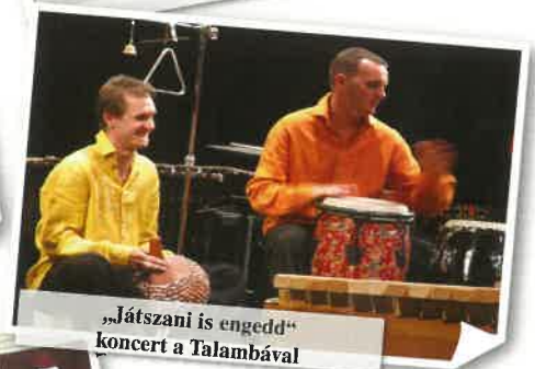
„Játszani is engedd” koncert a Talambával