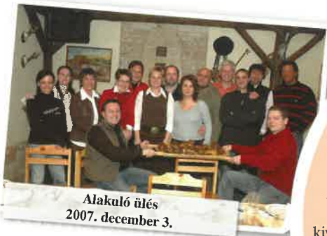
Alakuló ülés 2007. december 3.

Ezzel a mottóval indult útjára még 2007 végén a META Klub, amely októberben ünnepelte első születésnapját. Az egy év mérlege igen gazdag: az egyesület lelkes tagjai számos rendezvényt szerveztek annak érdekében, hogy a lakosság figyelmét felhívják a mentális egészség, a tiszta gondolkodás jelentőségére. A Mentális Egészségért Tenni Akarók Klubja úgy tűnik, kiválóan kiegészíti a pszichiátriai szakma ténykedését: a kulturális programok segítségével, a stresszoldás különböző formáit megmutatva a mentális betegségek megelőzésében, az ismeretterjesztéssel a tévhitet és a stigmák lebontásában vállal szerepet. S bár a születésnapjához ünnepélyesen elhangzott: talán kissé utópisztikusnak bizonyult a szlogen, az eltelt év tapasztalatai alapján azonban kijelenthetjük: egyáltalán nem baj, ha az értékmegőrzésben felfedezzük saját érdekeinket.