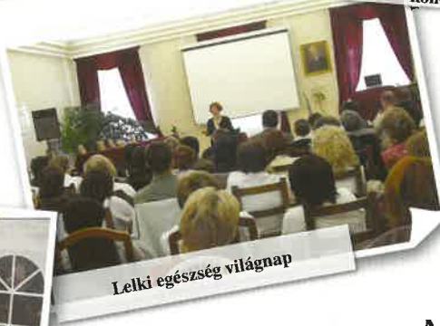
Lelki egészség világnap