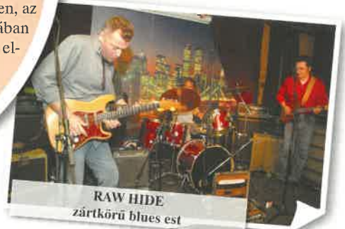
RAW HIDE zártkörű blues est