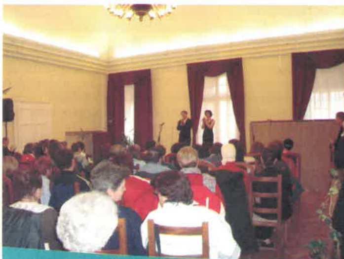
A Mór E. Csaba Színház színművészeinek külön köszönet a felejthetetlen délutáni előadásért

- zenés kavalkád a Mór E. Csaba Színház színészei közreműködésével