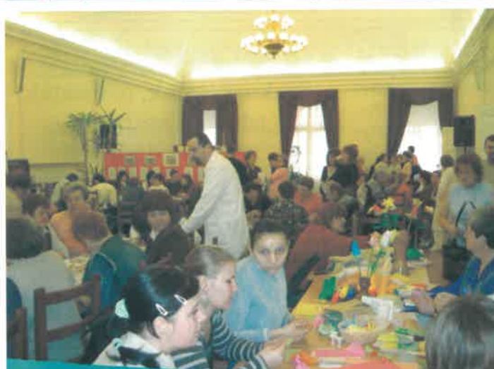
A nyitott rendezvényt nagy érdeklődés kísérte, több százan látogattak el szakkórházunkba