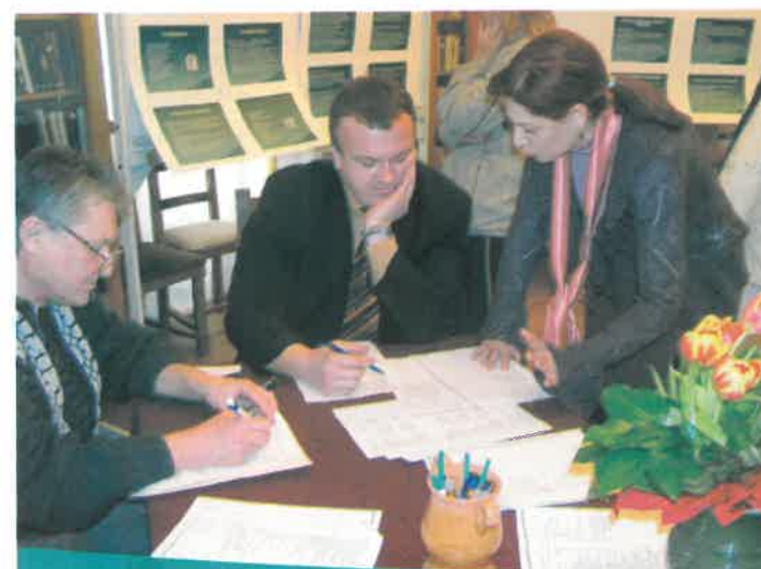
Nagykálló polgármestere is kipróbálta a különböző standokat