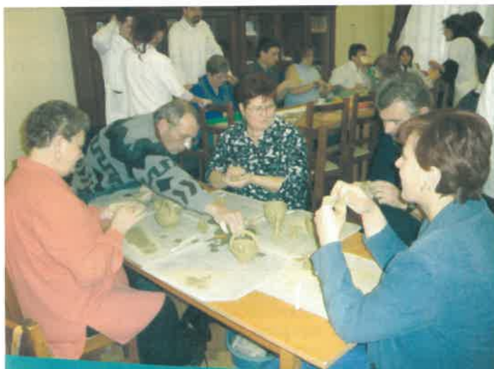
A különböző foglalkozásokat bárki kipróbálhatta, mely során gyönyörű alkotások készültek a látogatók kezei alatt...

(további képek honlapunkon: www.kallokorhaz.hu )