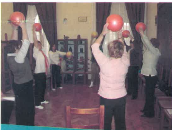
Bármikor elvégezhető gyakorlatok, melyek nemcsak a testet, de a lelket is felüdítik...