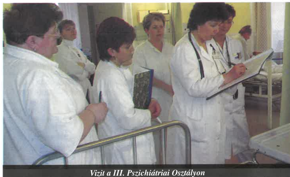
Vizit a III. Pszichiátriai Osztályon