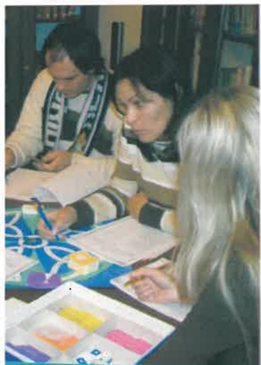
...és társasjáték a „PszichOázisban”