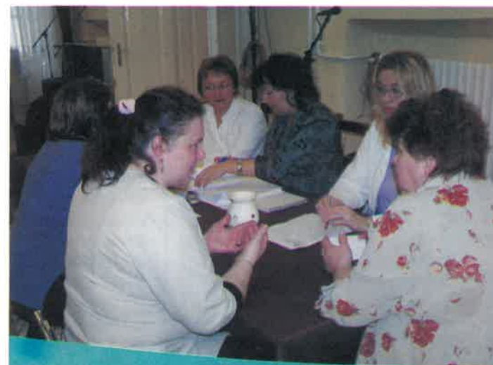
A legfrissebb jogszabályok, illetve a gyakorlati teendők kapcsán az érdeklődők tanácsot kaphattak jogász, szociális munkás, illetve pszichiáter munkatársunktól