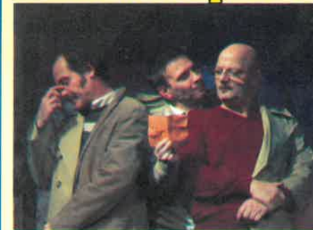
Yasmina Reza „MŰVÉSZET” vígjáték

Serge, a gazdag bőrgyógyász egy nap vesz egy kétszázézer frankot érő festményt, amely valójában nem más, mint egy egyhatvanszor egyhuszas, teljesen fehér téglalap. Marcot, Serge legjobb barátját felháborítja a gesztus, úgy érzi, a másik ezzel elárulta egykori eszményeiket, immár nem más, mint egy felfuvalkodott, gazdag sznob. Közös barátjuk, Yvan épp közelgő esküvőjével bajlódik, nem tudja, hogyan foglaljon állást a kirobbanó konfliktusban, melyben egy barátság és az emberi önazonosság, morális talpon maradás a tét... Yasmina Reza remek színpadi helyzetekben bővelkedő, árnyalt komédiája az 1994-es ősbemutató óta kirobbanó siker Európa színpadain, legalább ötven különböző helyen játszották, a budapesti Katona József Színházban eddig több mint 200 előadást ért meg.