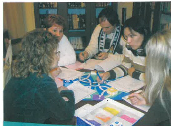
Nagy sikert aratott az önismereti társasjáték a „PszichOázisban”