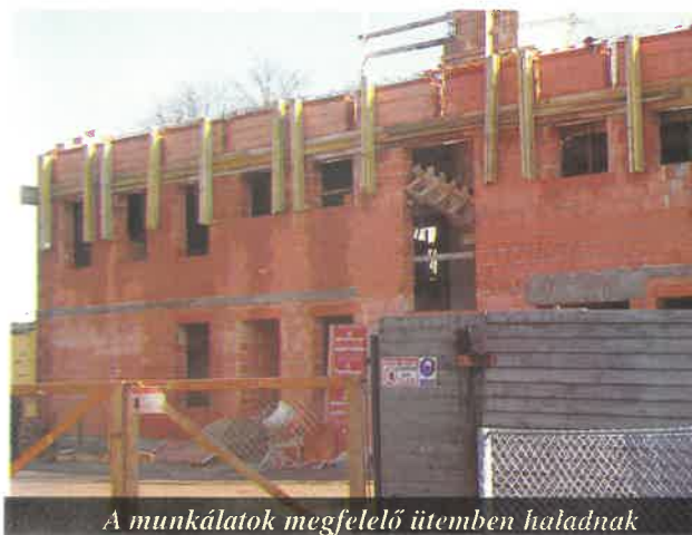
A munkálatok megfelelő ütemben haladnak