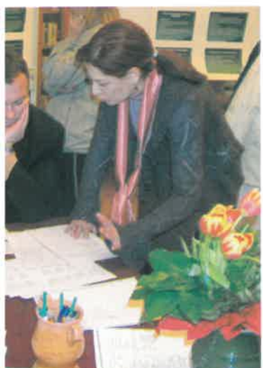
...nőstere is kipróbálta a különböző standokat